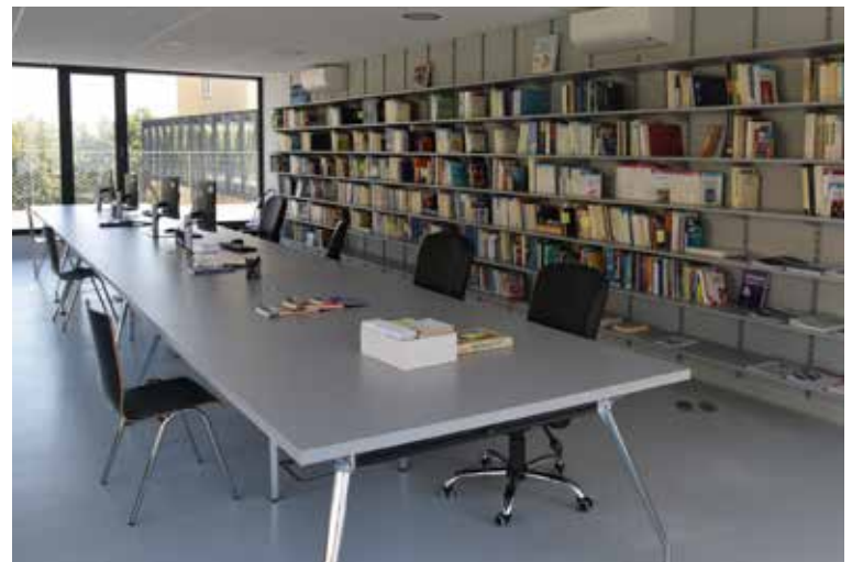
LÉKAŘSKÁ KNIHOVNA čítá přes 7 tisíc knih, v nové jsou jen nejnovější publikace.

V patře vznikla zasedací místnost pro školicí a vzdělávací akce. Jde o multiroom s obrazovkami, který mohou využít i lékaři, protože nabídnou možnost připojit se zde na video systém na operačním sále a sledovat online tým operatérů. Mohou se zde sledovat i výsledky všech zobrazovacích metod a prezentovat magnetické rezonance a CT vyšetření.