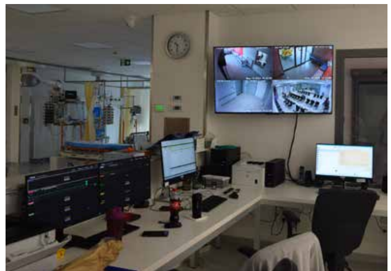
PACIENTY, KTERÉ PŘIVEZE LÉKAŘSKÁ ZÁCHRANNÁ SLUŽBA, přijmou lékaři na tzv. crash roomu se šesti lůžky vybavenými monitorovací technikou a dalšími přístroji.