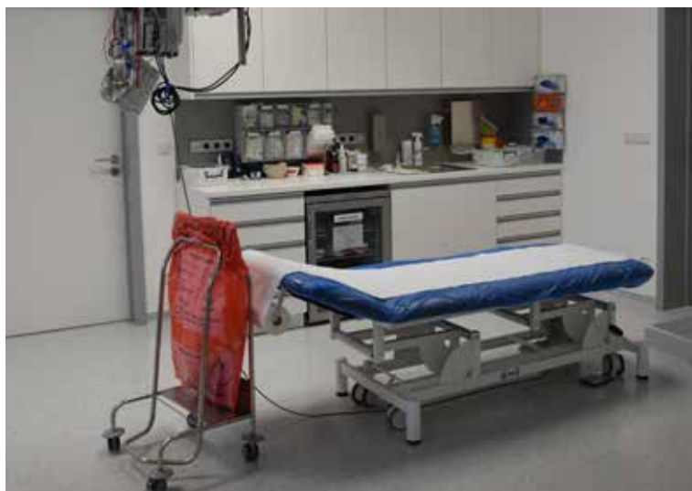
LÉKAŘI NA URGENTNÍ PŘÍJMU ošetří pacienty přímo na ambulancích, které jsou plně vybaveny. K dispozici je i sádrovna.

• Takže jsou ošetřeni přímo na tomto oddělení?