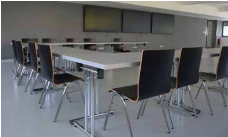
ZASEDACÍ MÍSTNOST pro vzdělávací a školicí akce využijí i lékaři pro video přenosy z operačních sálů.