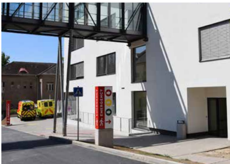
NOVÉ ODDĚLENÍ URGENTNÍHO PŘÍJMU vzniklo v nové přístavbě chirurgického pavilonu. Urgent nyní centralizuje péči, tedy lékař přichází za pacientem.