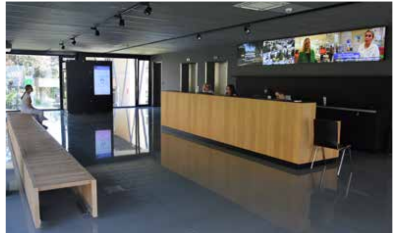
RECEPCE se nachází v přízemí. Výtahem lze vyjet i do nadzemního koridoru spojující pavilony I a CH.