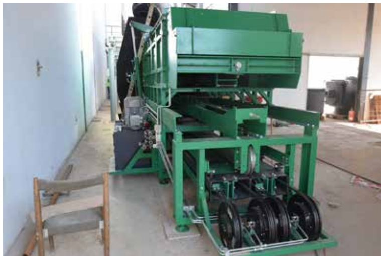
NOVÁ TECHNOLOGIE JE JIŽ NA MÍSTĚ. Modernizace skončí během prosince letošního roku.

technologie neumožňovala splnit předpisy pro vypouštění nebezpečných látek do ovzduší. Zaměstnanci tehdy zajistili projekt na novou spalovnu, včetně splnění všech legislativních požadavků pro výstavbu a provoz. Výsledkem bylo vybudování spalovny přímo v objektu kotelny s napojením na stávající infrastrukturu v roce 2001. Spojením kotelny a spalovny vzniklo energetické centrum. (zik)