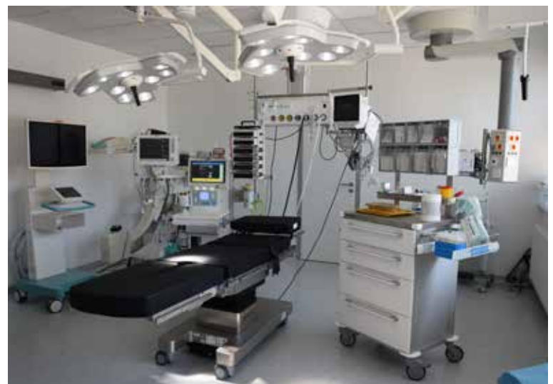
V ČÁSTI URGENTNÍHO PŘÍJMU je také zákrovový sálek pro ošetření ran a reponování zlomenin.