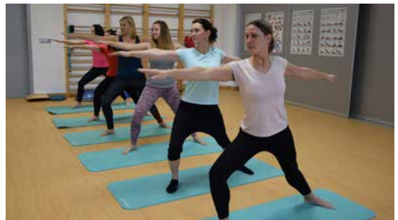
REHABILITAČNÍ CENTRUM NABÍZÍ CVIČENÍ JÓGY, kde se soustředí i na držení těla.