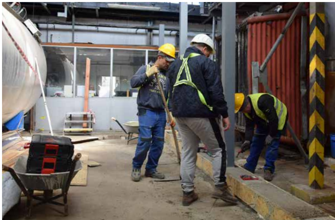
CENTRUM ŘÍZENÍ SPALOVNY se nyní společně s velínem kotelny přesune do nového prostoru energetického centra.