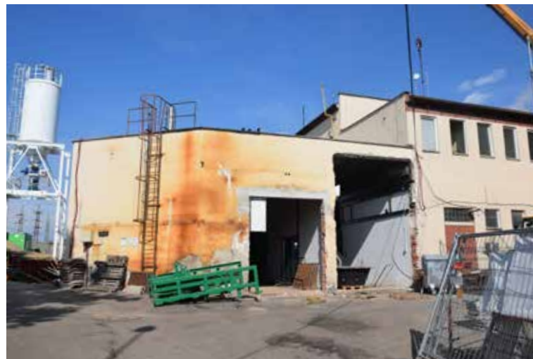
PŘI VÝMĚNĚ TECHNOLOGIE ve spalovně se musely zbourat i části zdí.