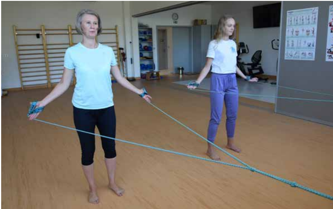
CVIČENÍ SPIRÁLNÍ STABILIZACE pomáhá při bolestech zad. Cvičí se pomocí elastického lana.

• Jóga, cvičení DNS nebo SM. Moderní, a hlavně účinná skupinová cvičení nabízí Komplexní rehabilitační centrum naší nemocnice. Lekce vedou přímo fyzioterapeutky či vyskolené lektorky a lekcí a zájemců neustále přibývá.