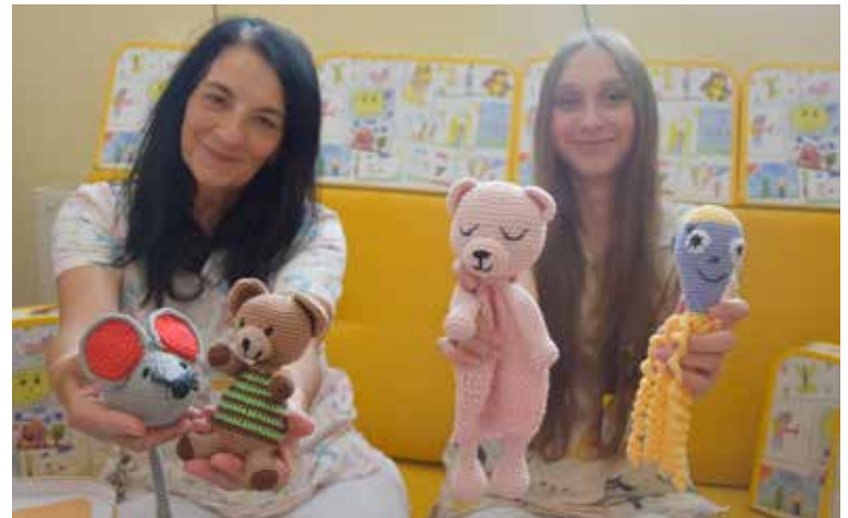
NAŠE NEMOCNICE rozdala odloženým dětem již osm kufříků, které obsahují osobní předměty jako je náramek či dudlík nebo fotografie.

„Vyplnit mezery a vzpomínky ze startu životního příběhu pomáhají sestřičky, které plní darované kufříky od Nadačního fondu La Vida Loca osobními předměty miminka jako je náramek, dudlík, hřebínek, lahvička, pletené hračky, oblečení. Tvoří fotografie, které zaznamenávají cestu jeho prvních dní